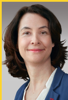
Estelle Brachlianoff, Diretora-geral da Veolia

E m toda a parte onde o grupo Veolia está implantado, este trata de promover, em coerência com a sua Razão de Ser, adotada a 18 de abril de 2019, os valores que lhe são específicos, as legislações próprias de cada país e as regras de conduta estabelecidas pelos organismos internacionais, assim como de favorecer a adesão às mesmas.